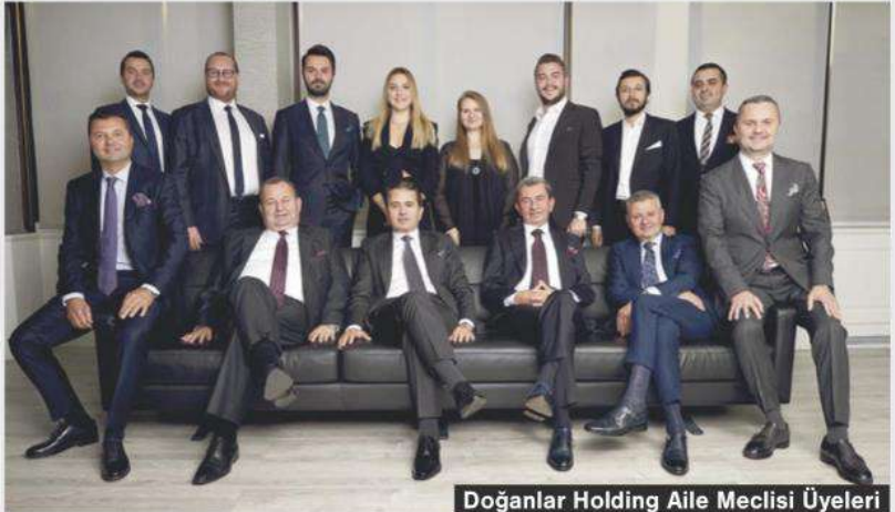
Doğanlar Holding Aile Meclisi Üyeleri

ORGANİZASYON YAPISI Biz kendi içimizde çok sesliliğe önem veren bir yapıya sahibiz. Yıllık planlarımızda da, yeni yatırım kararlarında da uzun ve çetin münazaralar yaparız. Hem bizler hem üçüncü kuşak olarak nitelediğimiz çocuklarımız ve profesyonel üst düzey yöneticilerimiz bu münazaralarda özgürce fikirlerini dile getirirler. Bu bence bir organizasyon için çok güçlü bir avantaj.