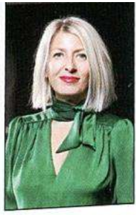
Çiğdem Yücesoy Subaşı