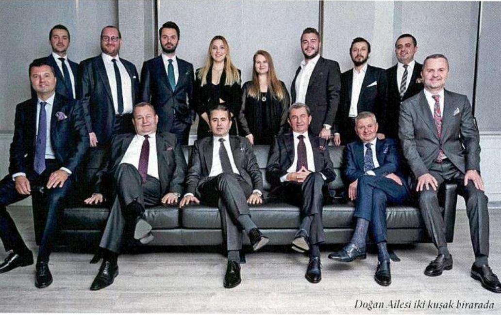
Doğan Ailesi iki kuşak birarada